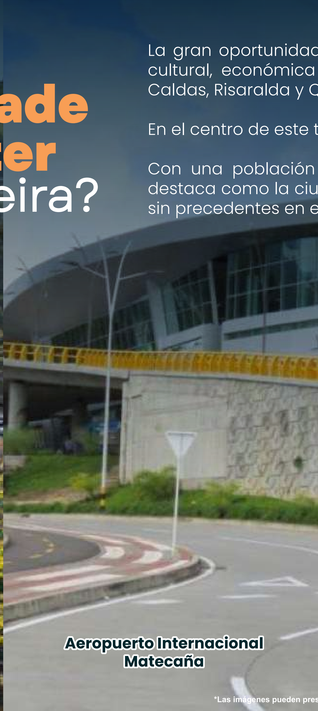
Aerpuerto Internacional Matecaña