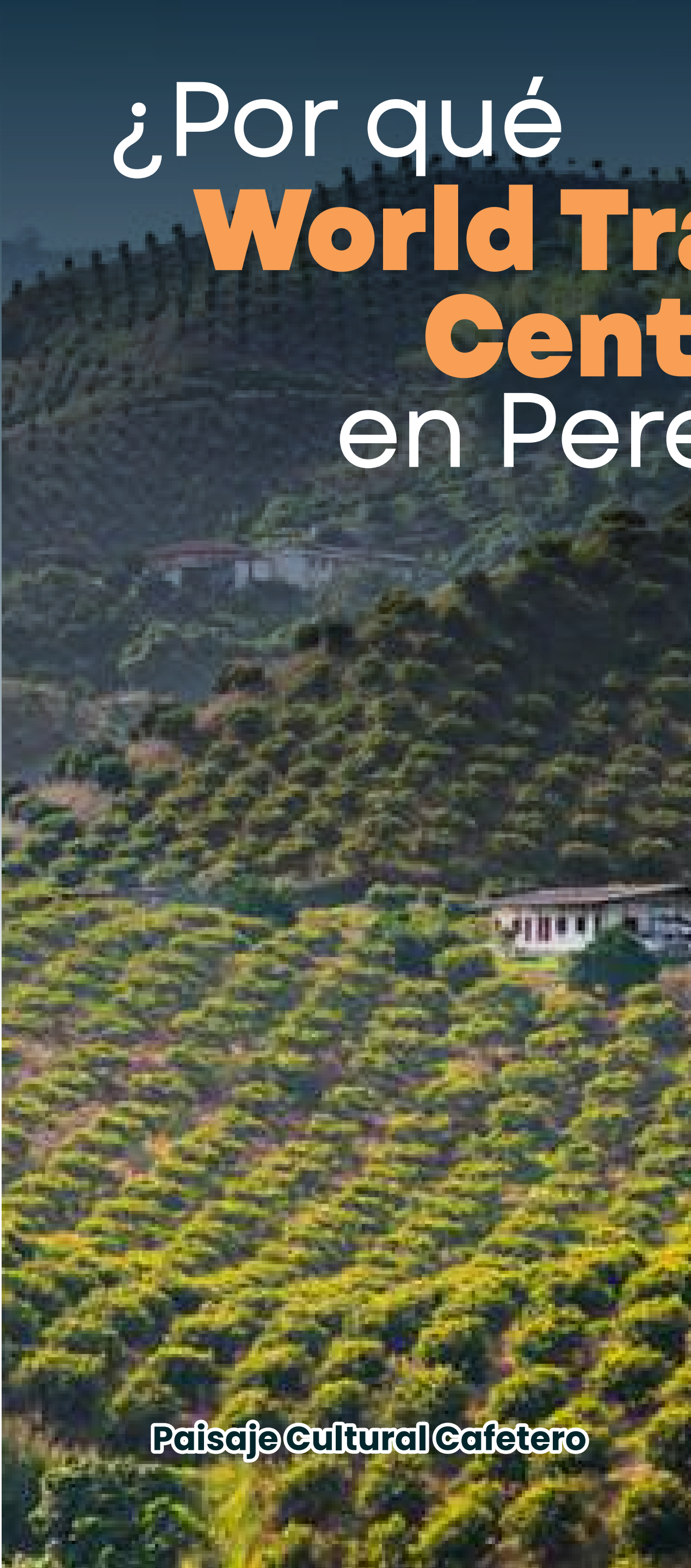
Paisaje Cultural Cafetero

Con una población circundante de aproximadamente 2.700.000 personas, Pereira se destaca como la ciudad más atractiva para invertir en la región, ofreciendo un potencial sin precedentes en el corazón del país cafetero.